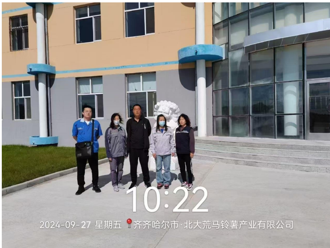
2024-09-27 星期五 齐齐哈尔市·北大荒马铃薯产业有限公司